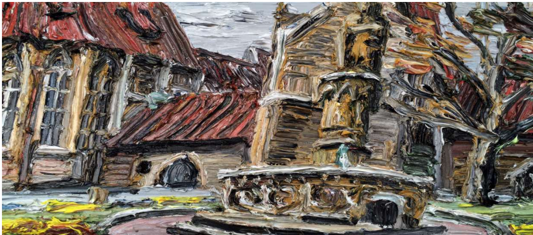
aus dem Diptychon „Naumburger Dom“ von Christopher Lehmpfuhl, 2016